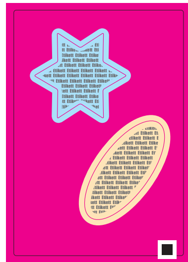
Beispiele - Schneidekontur

Farbige Hintergründe müssen 2 mm über die Schneidekonturen hinaus angelegt werden, um Blitzer zu vermeiden.